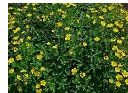
A POTENTILLA ANGUSTIFOLIA