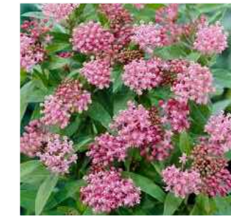
D ASCLEPIAS INCARNATA