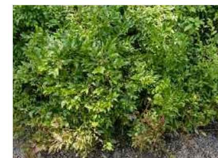
B VACCINIUM ANGUSTIFOLIUM