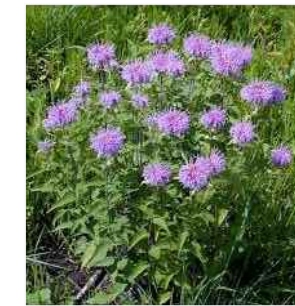
C MONARDA FISTULOSA