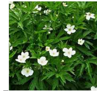
E ANEMONE CANADENSIS