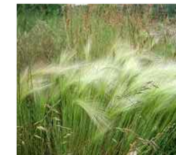
F HORDEUM JUBATUM