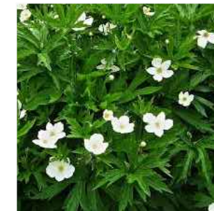
C ANEMONE CANADENSIS