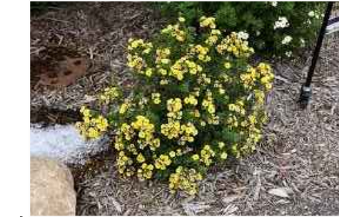
A POTENTILLA FRUCTICOSA