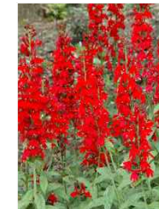
D LOBELIA CARDINALIS