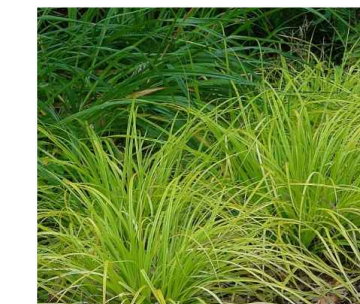
E CAREX AUREA