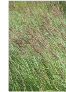
B CALAMAGROSTIS CANADENSIS