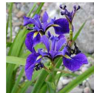
G IRYS VERSICOLOR