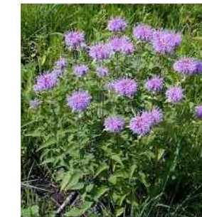
E MONARDA FISTULOSA