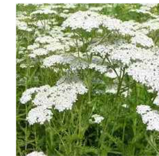
D ACHILEA MILLEFOLIUM