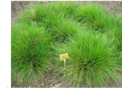
A DESCHAMPSIA CESPITOSA