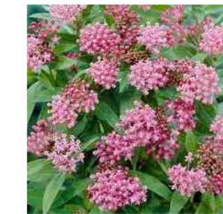
C ASCLEPIADE INCARNATA