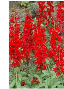
B LOBELIA CARDINALIS